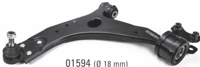
01594 (Ø 18 mm)