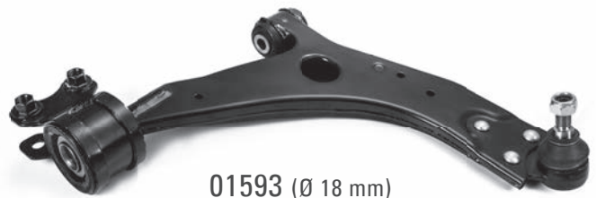
01593 (Ø 18 mm)